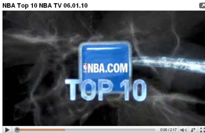
Eksempel på NBA TV henvisning til NBA.com taget fra Youtube.com